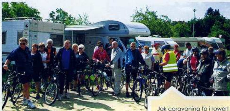
Jak caravaning to i rower!